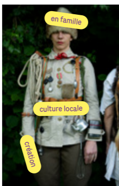
En partenariat avec le festival Marmaille - Du 19 au 29 oct. Lillico, Rennes - lillicojeunepublic.fr

JEU. 21 OCTOBRE 10 H* ET 14 H 30* VEN. 22 OCTOBRE 14 H 30* ET 19 H